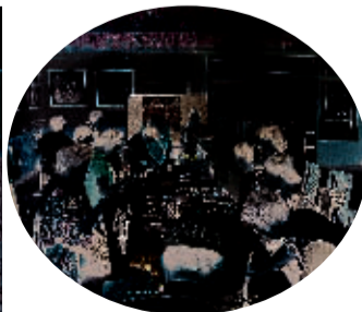
↑书画班活动现场气氛热烈