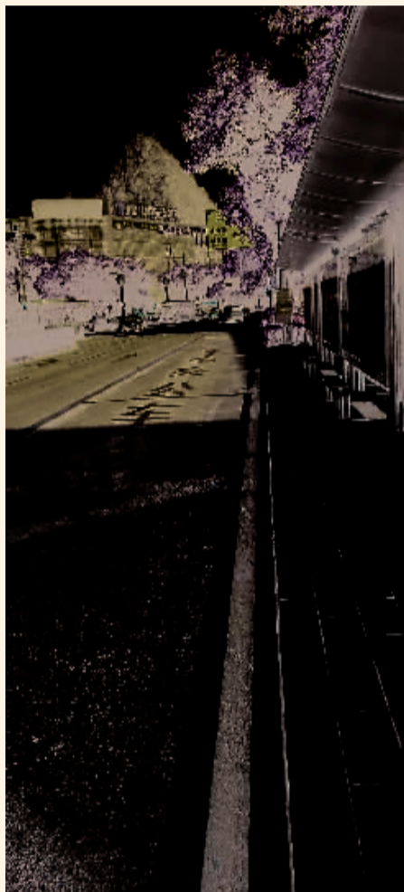
东镇路站点完成了标线施划。

据悉,截至目前,桂林公安交警部门对市区公交站点施划标线共80个,施划工作仍按计划有序开展。下一步,交警部门将通过“电子警察”与路面巡逻等方式,对在公交站点违法停车的车辆予以处罚,还将借助公交车上配备的监控设备对公交站点的违停车辆进行取证并处罚。