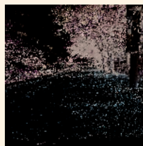
↑从前的道路满是泥土。