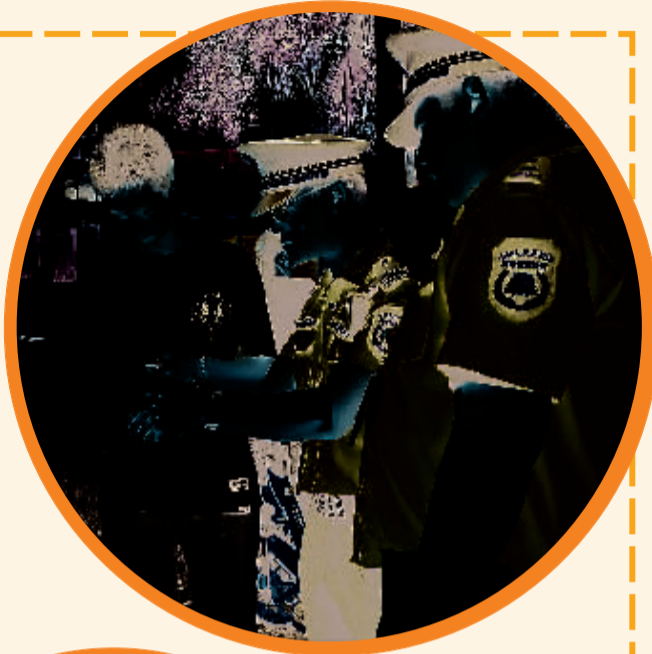
↑执法人员对乱扔烟头的男子进行劝导教育，并处罚。

“下一步，不文明专项整治小组将加大巡查力度，对城区各类不文明行为进行处罚，希望广大市民朋友爱护城市环境卫生，共同维护好市容市貌，争做文明桂林人。”负责人说。