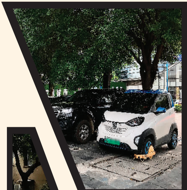
↑在桂林供电局附近，一辆车被上了轮胎锁。