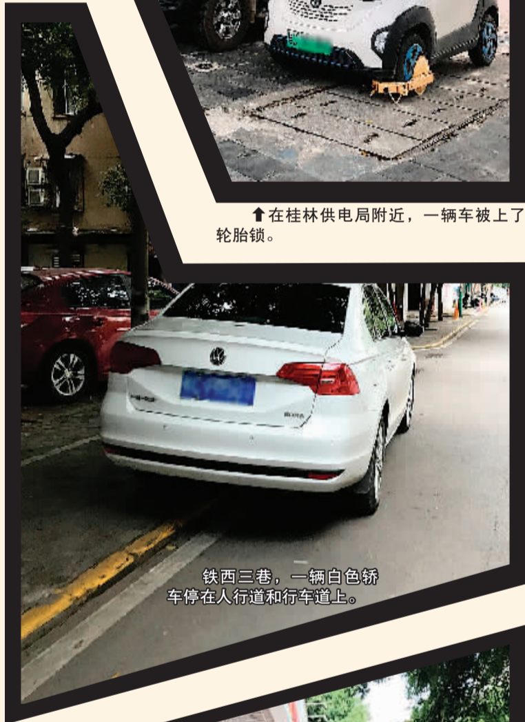
铁西三巷，一辆白色轿车停在人行道和行车道上。