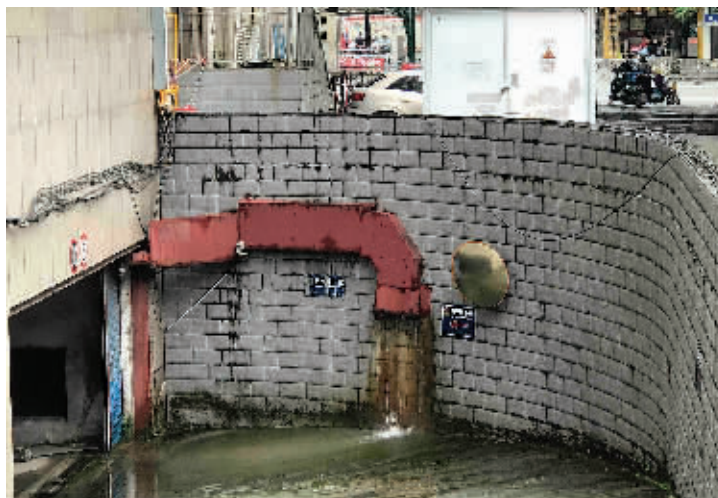
9日，红色电缆箱内流出大量污水。

本报讯（记者周子琪 通讯员黄晓）“快点过来看看，我们小区地下车库入口的电缆箱一直流污水，可能会漏电，物业也找不到原因，请你们帮帮忙。”6月8日，育才大厦的物业经理给三里店社区打来了求助电话，接到电话后，社区工作人员立即赶往现场。