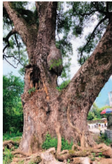
↓7个成年人方能合抱的古樟