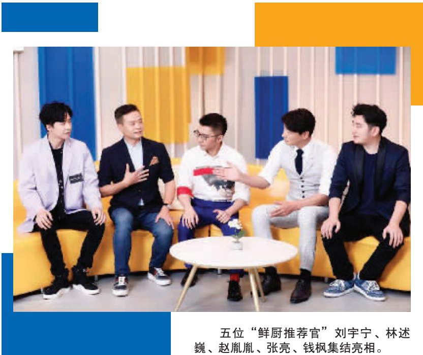
五位“鲜厨推荐官”刘宇宁、林述巍、赵胤胤、张亮、钱枫集结亮相。

湖南卫视全新原创美食少年先锋成长试炼记《鲜厨100》，将于5月21日晚首播。5月16日，节目举行了在线“云发布会”，张亮、赵胤胤、钱枫、刘宇宁、林述巍五位“鲜厨推荐官”与第一期的“鲜厨”代表李子峰、冯伟、余崇鉴集体亮相，首度与媒体见面，畅聊录制故事。另外，节目会有数十位元厨艺少年通过厨艺比拼，争夺直通《中餐厅4》的名额。