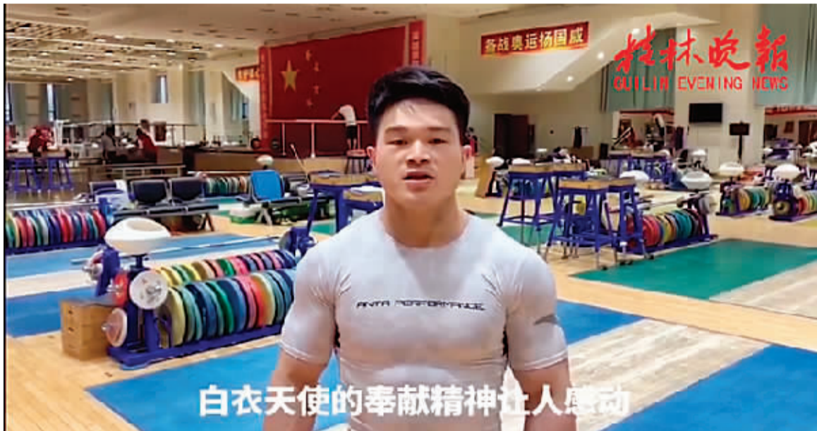
白衣天使的奉献精神让人感动

3月20日，桂林籍奥运冠军石智勇给桂林日报社新媒体中心发来一段视频。原来，这位桂林小伙从新闻上得知桂林医务人员驰援湖北后，很感动，想通过桂林日报社新媒体中心向奋斗在疫情防控一线的白衣天使们致敬！