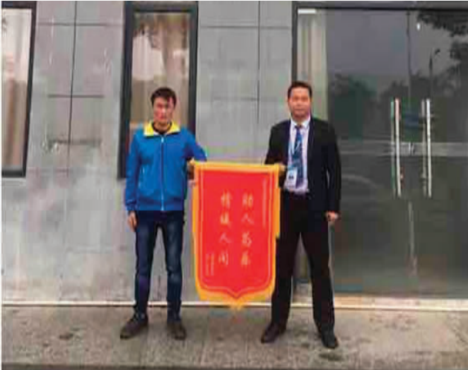
蒋先生给保安送来锦旗。