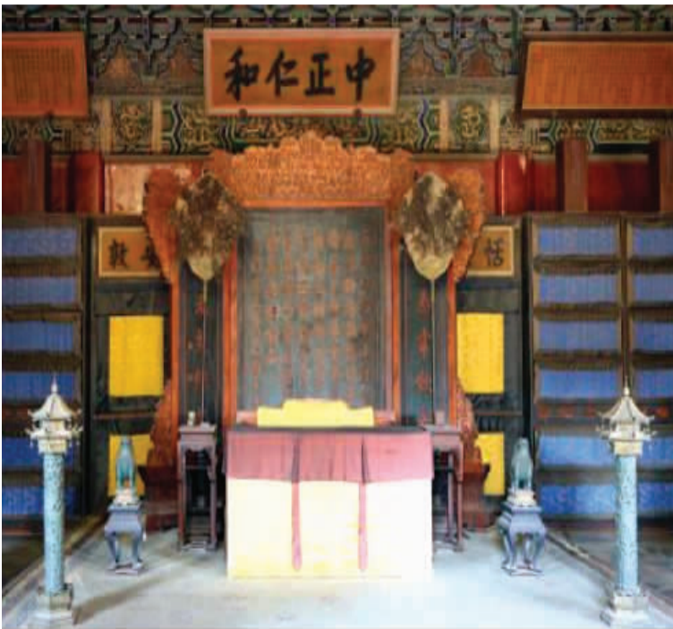
故宫养心殿前殿内景（资料图）

为了按照故宫官式古建筑营造技艺进行修缮，工匠都经过了故宫老师傅的专门培训，必须“持证上岗”。维修过程中，专家将全过程巡视、指导、监督。工程队还像考古队一样设置了领队，每天监督工程的实施。