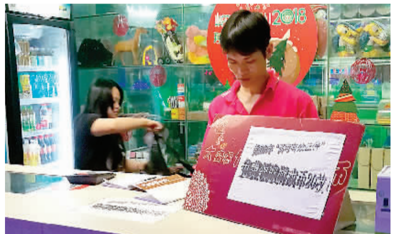
某电玩城推出凭准考证赠送游戏币活动。