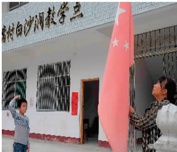
←每周一次的升旗仪式是必不可少的。