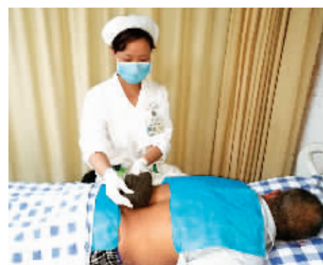
康复护士悉心为患者做中药熨烫治疗。

功能障碍恢复了就行，但常忽视病人心理康复。康复医学正是当今社会所倡导的生理、心理、社会相结合的治疗模式，真正做到了以人为本，让很多患者从阴霾中走出，无数个家庭转悲为喜。这样的医学理念就像冬日暖阳，给在病痛中挣扎的人们带去欣喜、振奋和期盼。这背后也深藏着医务人员对患者付出的精力和心血，有着不是亲人胜似亲人的情感。