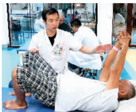
康复师一对一为患者做PT治疗。