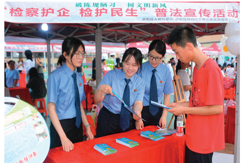
▲灌阳县人民检察院在现场进行普法宣传