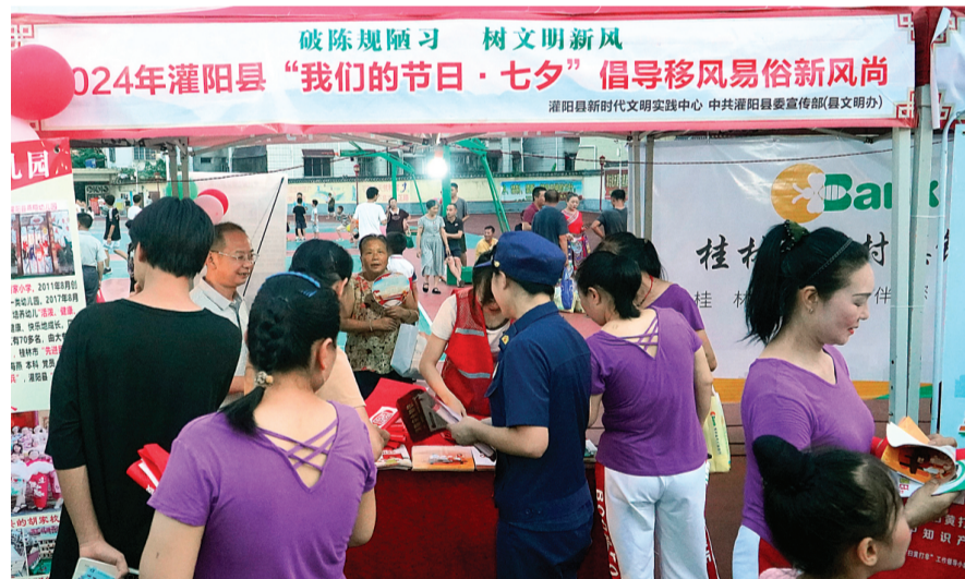
▲灌阳县文明办在活动现场进行移风易俗宣传