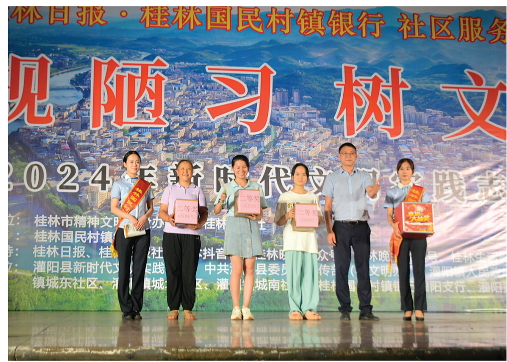
▲桂林国民村镇银行奖品赞助的幸运大抽奖二等奖颁奖