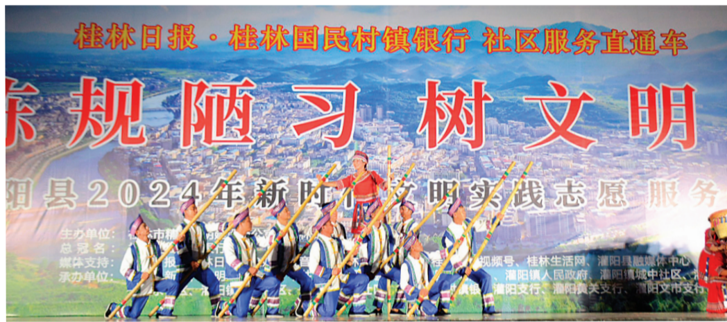
▼灌阳镇三联村文艺队表演的《新采茶舞》