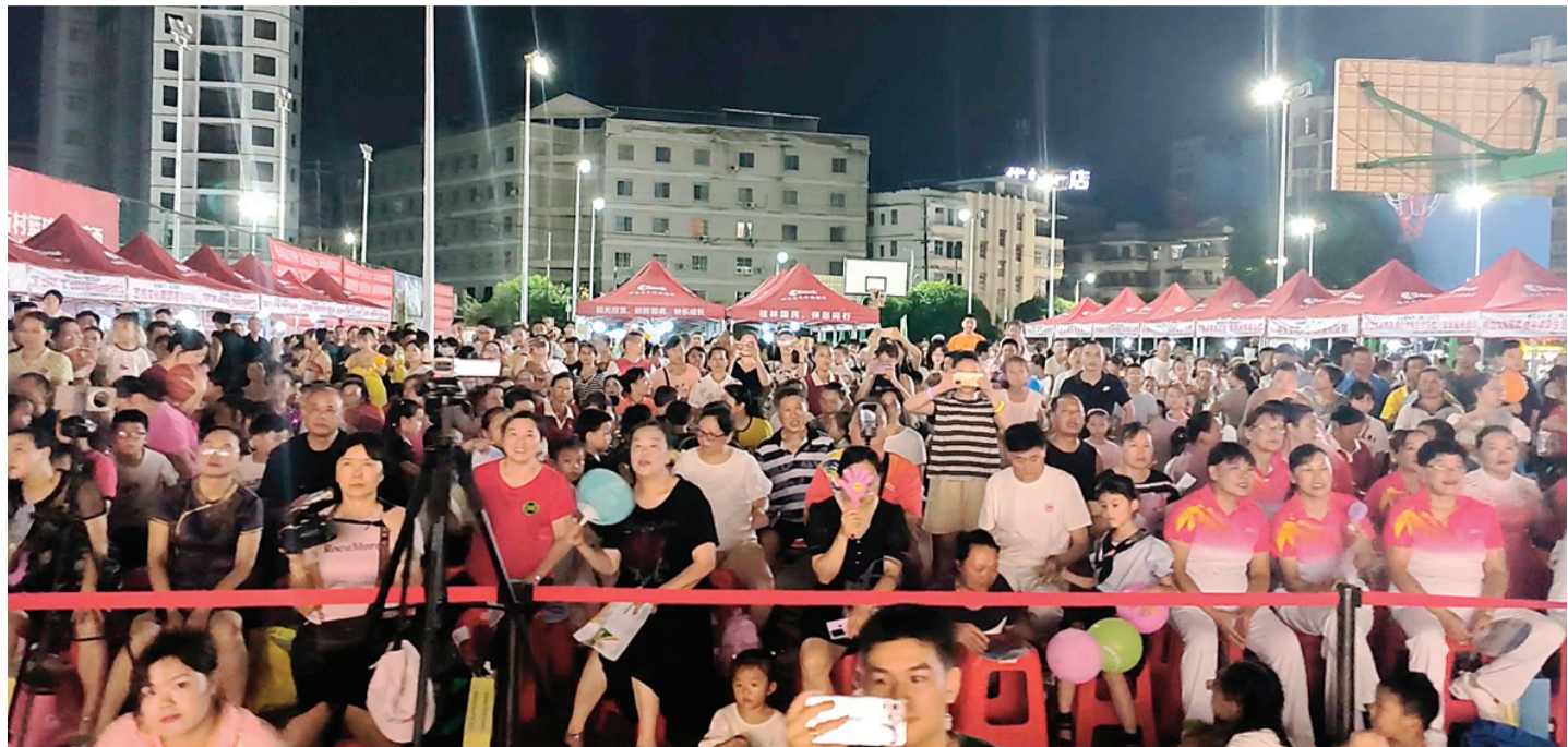
▲广场上坐满了观看演出的群众