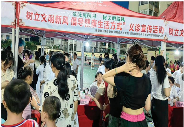
▲灌阳县人民医院专家在现场开展义诊活动