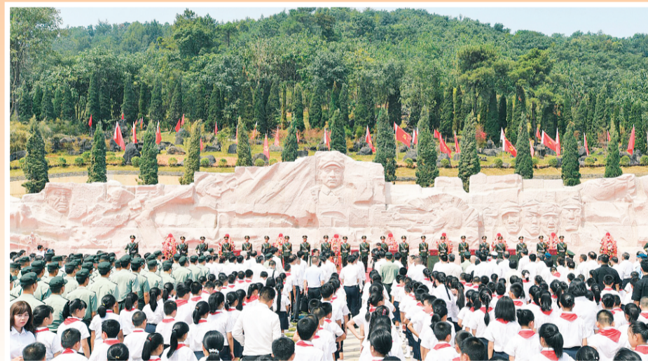
▲湘江战役纪念馆吊唁广场的“红军魂”雕塑长80米、高7米，巨石琢就，形如长城。主雕塑以红军34师师长陈树湘为原型，刻画红军指战员浴血奋战的场景，再现湘江战役的悲壮历史。纪念石林以古岭头石碑为原型，选取黑色石灰石、青松、红枫、香樟、银杏、竹子等，以生态自然的方式摆布，体现“一草一木一忠魂、一山一石一丰碑”的丰富内涵，表达对红军烈士的永久怀念。（资料图片）

战役红色文化建设提升工作组，深入发掘保护红色文化遗址遗存，统筹规划建设湘江战役纪念馆；积极推动湘江战役遗址保护立法，《桂林市红军长征湘江战役红色资源保护传承规定》已经自治区人大常委会批准，将于2023年12月1日起正式实施。