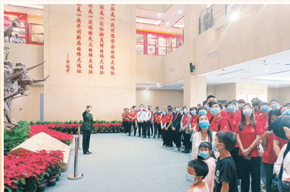
▲桂林市全面用好用活红色资源，推动领导干部学史明理、学史增信、学史崇德、学史力行。图为干部群众在全州县红军长征湘江战役纪念馆接受党史教育。（资料图片）

为全力打造湘江战役纪念馆体系，更好地保护和弘扬红色文化，传承红色基因，桂林市成立桂林红军长征湘江战役文化保护传承中心，全力保护好、管理好、运用好红色资源；组建湘江