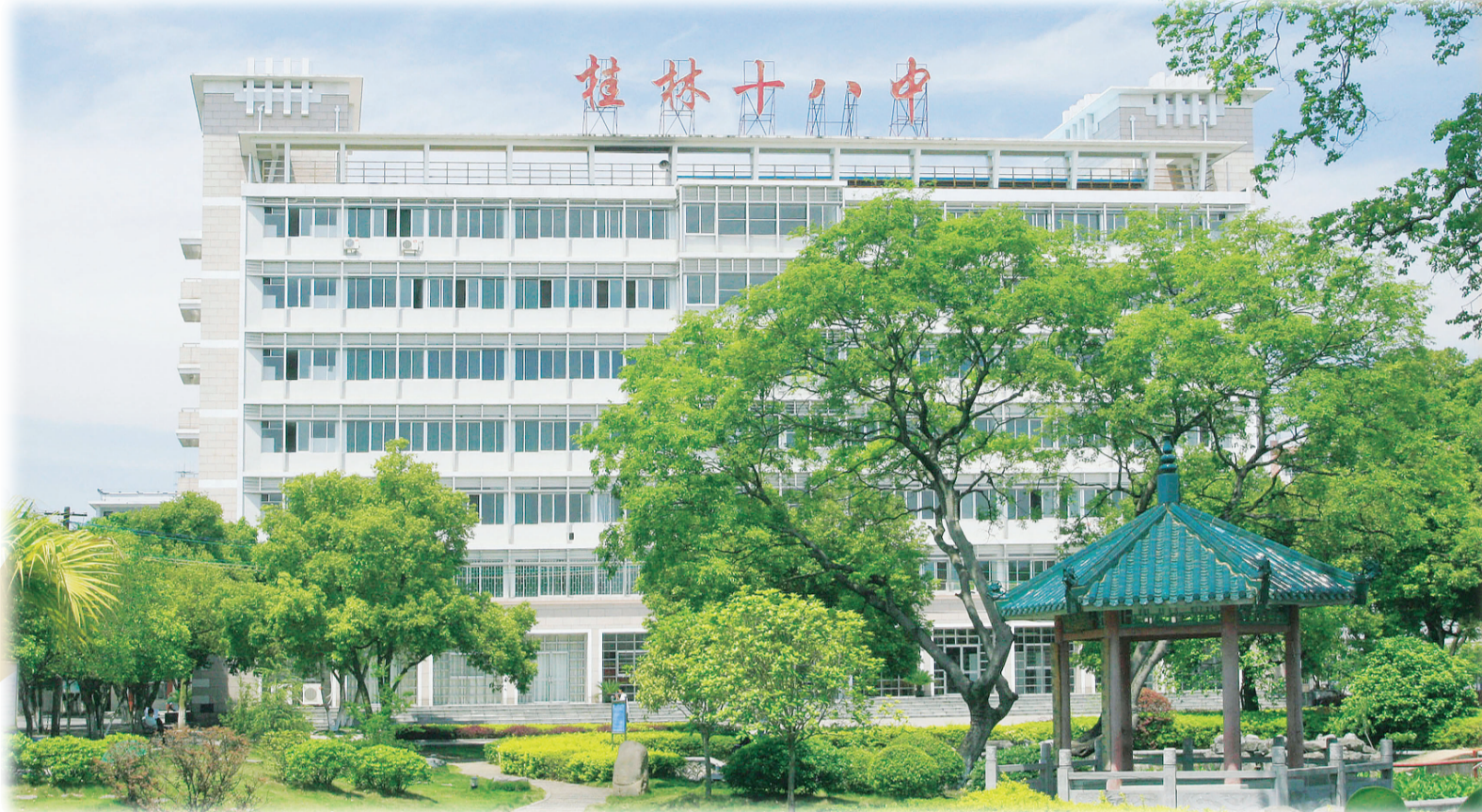
◀十八中校园实景图——位于校园中心区域的科技综合楼。

相关数据显示，该校自创办以来已为党和国家培养了3万多名高素质人才，赢得了桂林社会各界的高度认可与广泛赞誉。学校还先后获得“中央教科所科研示范校”“全国教科卫体系统先进工会组织”“自治区先进基层党组织”“自治区文明单位”“自治区民族团结进步先进集体”“自治区校园文化建设先进学校”等等荣誉称号。近年来更是在拔尖创新人才培养方面不断探索，形成了以“党建”“文化”“校本课程”为基础的特色路径。