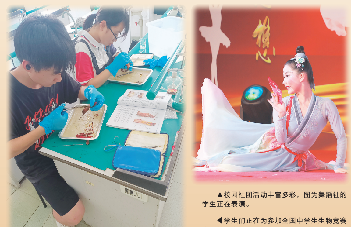
▲校园社团活动丰富多彩，图为舞蹈社的学生正在表演。