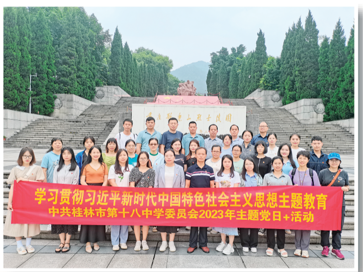
▲学校党组织教师前往重庆开展主题党日活动。