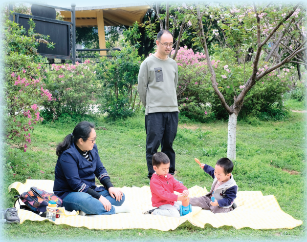
▶在南溪山公园，一家人其乐融融地在花丛中玩耍。