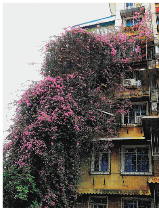
▶2021年10月，两株“网红”三角梅盛开时如同花之瀑布。

市第二绿化工程处相关人士介绍，对三角梅断裂的粗大树干，市绿化工程处还使用“随车吊”将其运回苗圃培育，待其生根长叶后，再移植到公园或城市绿地里，争取再打造出一处绿化美化特色景观。