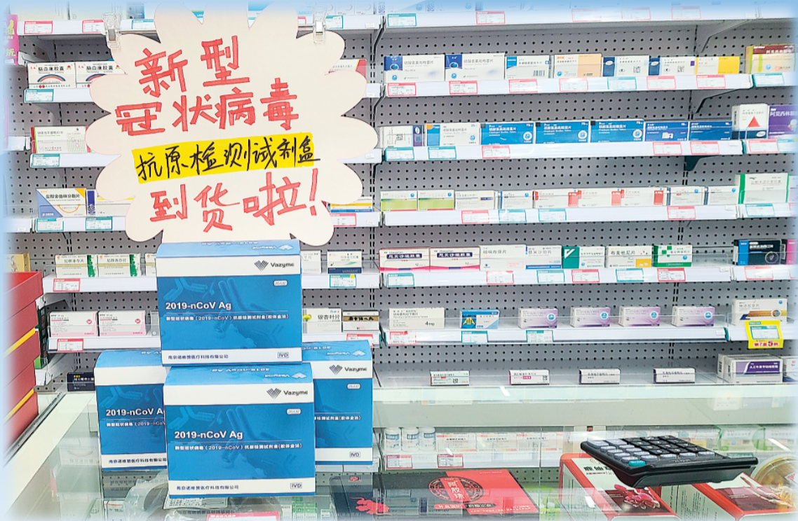
▲在某药店内显眼处，新冠抗原检测试剂盒成为了店内主角。

日前，首批新冠病毒抗原检测试剂盒正式在桂林开售。具体怎么买？怎么测？可以取代核酸检测吗？3月29日，记者走访了市内多家药店。