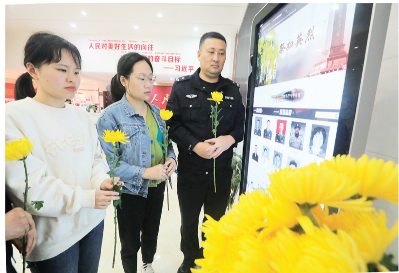
▲为缅怀先烈、弘扬中华传统美德，3月30日上午，秀峰街道解东社区结合当前新冠肺炎疫情防控工作实际，联合白龙派出所积极引导辖区居民和退役军人开展“我们的节日·清明——网上祭英烈”主题活动，用绿色环保的文明祭扫方式缅怀先烈。

另据悉，广西遗体器官捐献者纪念馆（桂林园）自2019年4月落成启用以来，已成为我市及周边地区捐献者家属缅怀纪念捐献者的重要场所。经捐献者家属同意并授权，目前桂林园已为448名捐献者免费在纪念碑镌刻姓名，以此铭记他们的无私奉献。