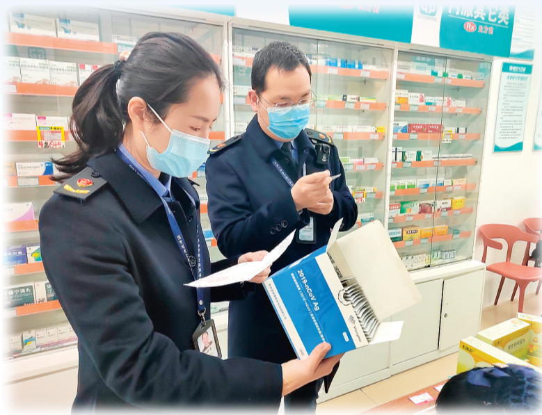
▲市场监管人员正在对药店内销售的试剂进行检查。

不光是线下门店，线上平台同样可以购买到自测试剂盒。在某电商平台，键入“抗原自测”即可看到各品牌试剂盒，规格有5—20份不等，价格也有所差异。如，某品牌试剂盒在电商补贴优惠叠加下，单份试剂盒售价仅为9.9元；而另一品牌试剂盒单份价格为14.9元。尽管均称有现货可快速发货，但无法使用医保支付。