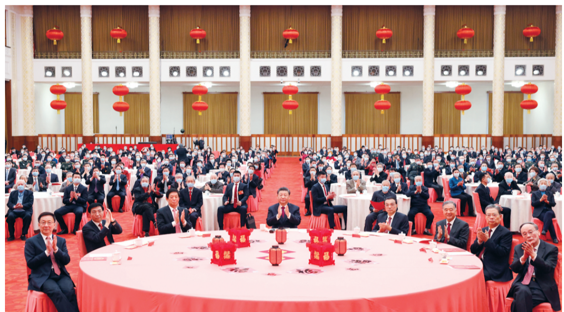
▲ 1 月 30 日,中共中央、国务院在北京人民大会堂举行 2022 年春节团拜会。党和国家领导人习近平、李克强、栗战书、汪洋、王沪宁、赵乐际、韩正、王岐山等同首都各界人士欢聚一堂,共迎新春。

第三个历史决议,如期打赢脱贫攻坚战,如期全面建成小康社会,实现第一个百年奋斗目标,开启全面建设社会主义现代化国家新征程,在中华民族伟大复兴历史进程中写下了浓墨重彩的一笔。我国经济发展和疫情防控保持世界领先,构建新发展格局迈出新步伐,高质量发展取得新成效,国家战略科技力量加快壮大,改革开放迈出新步伐,民生保障有力有效,生态文明建设持续推进,碳达峰碳中和工作全面部署,国防和军队建设有力拓展,香港实现由乱转治,反“独”促统斗争不断加强,中国特色大国外交继续推进,党史学习教育成效显著,社会大局保持稳定,“十四五”实现良好开局。在百年变局和世纪疫情交织的复杂形势下,我们取得这些成绩,极大