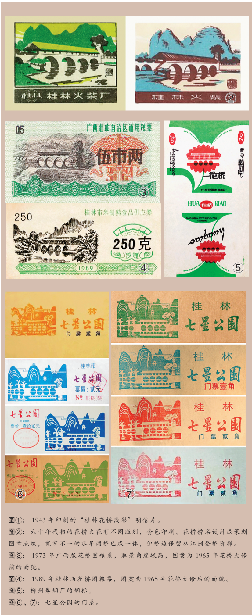
图①：1943年印制的“桂林花桥浅影”明信片。 图②：六十年代初的花桥火花有不同版别，套色印刷，花桥桥名设计成篆刻图章点缀，宽窄不一的水旱两桥已成一气，但桥边保留从江洲登桥阶梯。 图③：1973年广西版花桥图粮票，取景角度较高，图案为1965年花桥大修前的面貌。 图④：1989年桂林版花桥图粮票，图案为1965年花桥大修后的面貌。 图⑤：柳州卷烟厂的烟标。 图⑥、⑦：七星公园的门票。