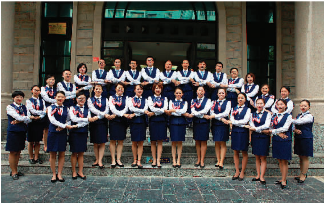
交通银行桂林分行营业部集体照。

文明建设就像一面旗帜,凝聚着一个企业的思想灵魂,代表着一个企业的整体形象,彰显着一个企业的特色风貌。交通银行桂林分行营业部将持之以恒深入学习贯彻习近平新时代中国特色社会主义思想和十九届二中、三中、四中全会精神,牢记服务地方实体经济初心使命,砥砺前行,用心抓好精神文明建设,树立全员积极向上、为民服务的新风尚。