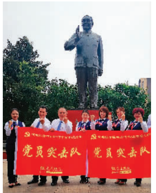
交通银行桂林分行营业部党员突击队照。