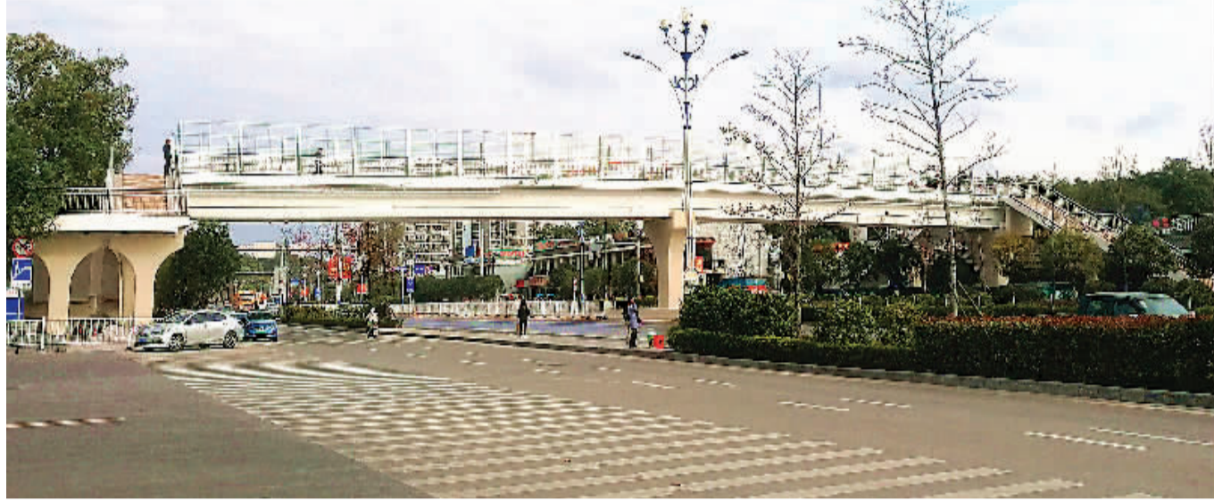
桂林理工大学雁山校区东大门人行天桥建成通行。

市市政建设有限公司相关负责人介绍,该天桥横跨的桂阳公路是市重要旅游通道,路面较宽,车流量非常大,而附近的师