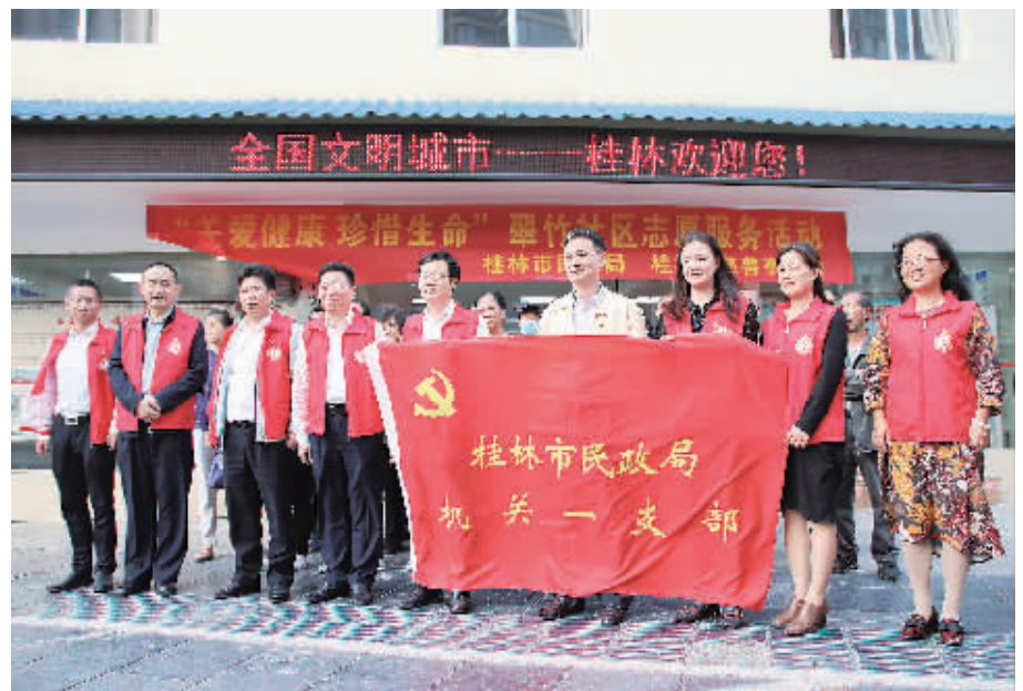
▲桂林市民政局志愿服务队的身影活跃在社区