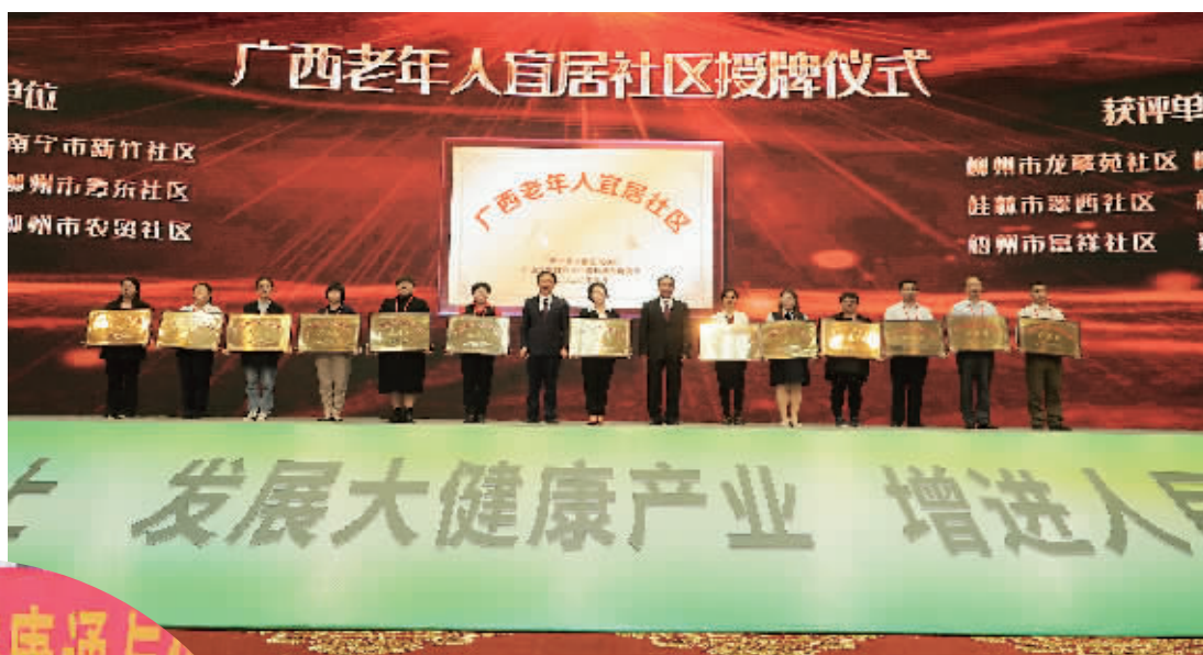
▲象山区凯风社区、翠西社区获得自治区老年人宜居社区命名

今年以来,桂林市养老服务工作不断取得新成绩,各级民政部门战斗在一线,把群众的需要放在第一位,将养老服务体系建设作为重点工作来抓。象山区凯风社区秉持“党建+民生+服务”的治理理念,打造“志愿先锋·七彩凯风”特色党建品牌。联合“12349”象山区凯风路养老服务服务中心为老人提供膳食供应、个人看护、保健康复、休闲娱乐、心理咨询等服务。同时,社区自行开展“爱心敲门”行动,每半年对辖区80岁以上的老人家庭敲门走访,了解他们的生活情况和对社区工作的意见和建议,让辖区老人老有所养、老有所依、老有所乐。对辖区行动不便、残疾和空巢老人等困难群众开设了“爱心2号键”,只要长按2号键,电话就会接通社区党委书记或副书记、党支部书记,为群众及时解难;翠西社区老龄化率达到42%,有近一半的老年居民。社区组建“手牵手”党员共建志愿服务队、“俏夕阳”文体娱乐志愿服务队、“爱心愿”医疗卫生志愿服务队、“全能干”家电维修志愿服务队、“贴心聊”咨询类志愿服务队、“红袖标”义务巡逻志愿服务队