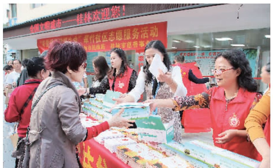
▲桂林市民政局、桂林市慈善事业会在翠竹社区开展疫情常态化防控慈善宣传活动