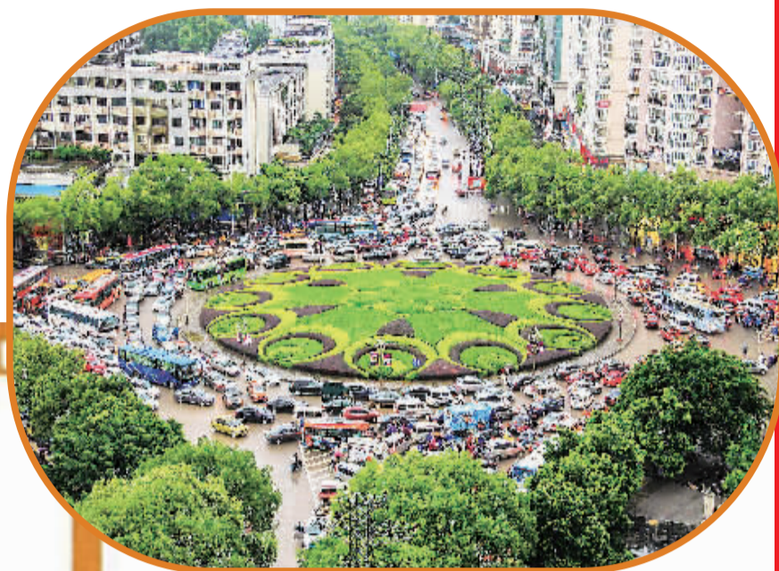
▲改造前拥堵的三里店大圆盘路口。