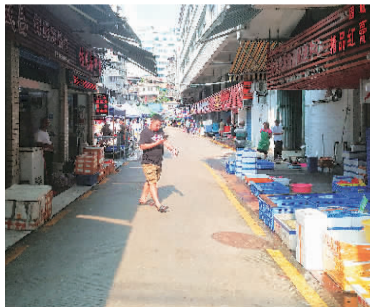
▲西门市场水产区经过整治，焕然一新。

创城，创一座美好、幸福之城。桂林创城以来的无数变化，让群众真实感受文明创建带来的实惠，共享文明创建的丰硕成果。