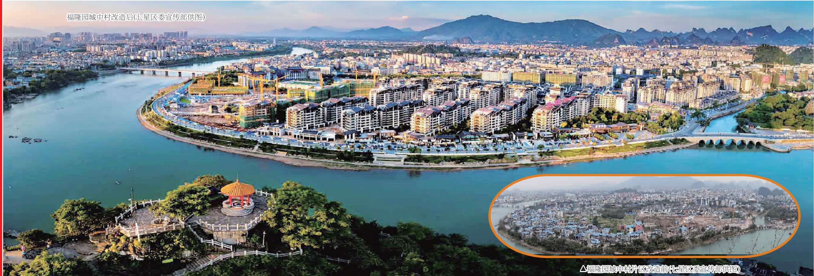
△福隆园城中村片区改造前