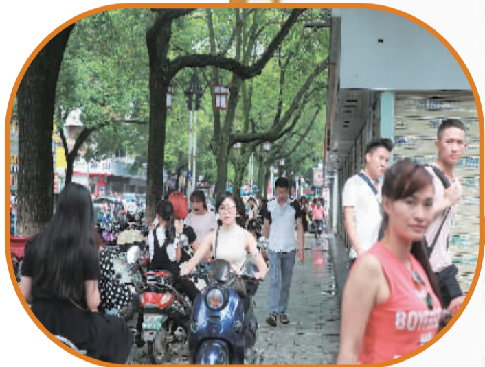
▲改造前的依仁路。人行道被一排小木屋占据，电动车与行人抢道。