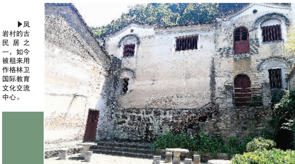
▶凤岩村的古民居之一,如今被租来用作格林卫国际教育文化交流中心。