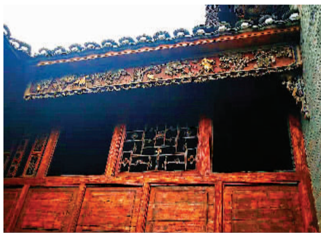
▲朗山古民居的木雕。