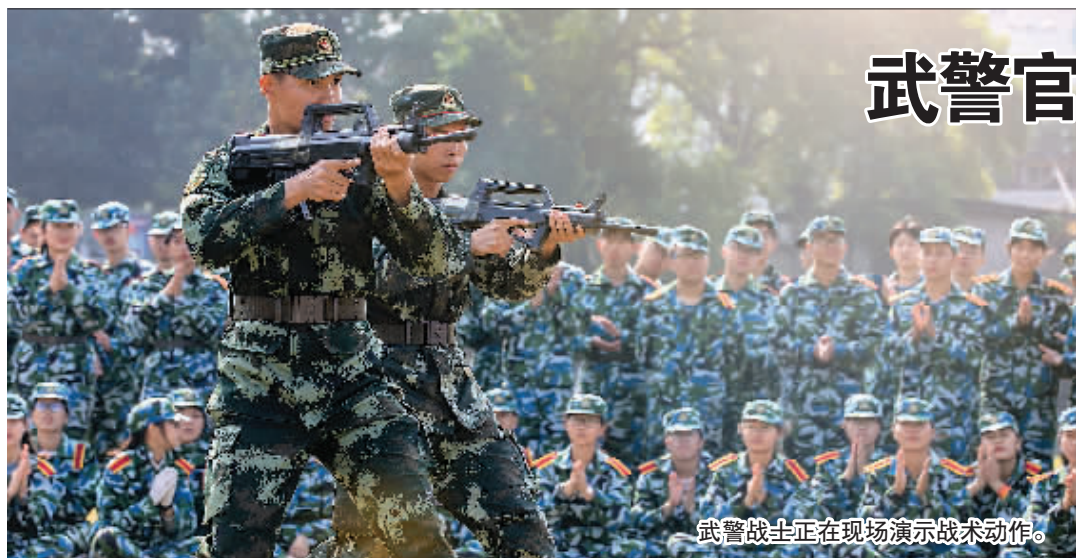
武警战士正在现场演示战术动作。

本报讯(记者陈静 通讯员陈登科 张家硕 文/摄)整齐的队伍，洪亮的口号声，近日，武警广西总队桂林支队官兵走进广西师范大学育才校区，为学生们带来了一场别开生面的国防教育活动。官兵们通过国防知识宣讲、军事训练课目展示、互动交流等形式，让学生们近距离感受军营文化，接受国防教育。