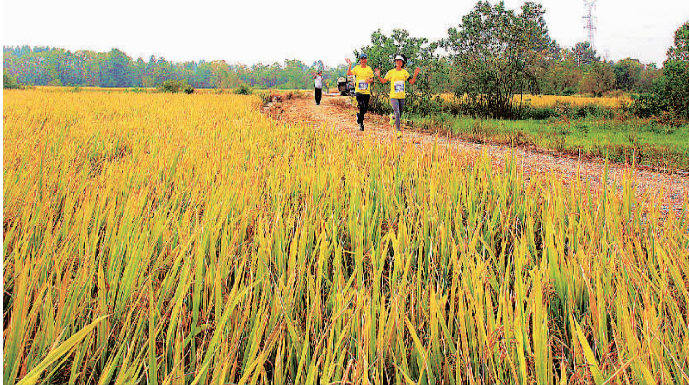
▲参加田园跑的选手还可以欣赏沿途优美的风景。