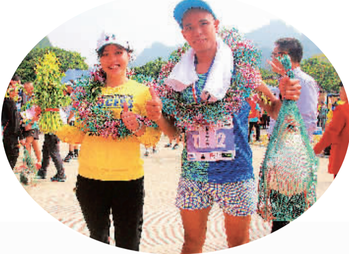
▲获半程马拉松赛男子、女子组冠军选手收获了特别的奖品:一把有机蔬菜和一只鹅。

据了解,四塘镇是临桂区贫困人口最多的乡镇,2015年开展精准扶贫时,共有建档立卡贫困户1079户4405人。经过几年的脱贫攻坚大会战,截至2019年底,1016户4199人已成功脱贫摘帽,剩下的63户206人也在今年10月通过“双认定”达到脱贫标准,将于年底如期脱贫摘帽。