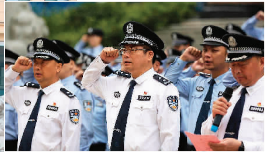
▲10月1日，市公安局举行升国旗仪式，并向警旗宣誓。副市长、市公安局局长朱永辉携在家全体党委班子成员出席仪式。