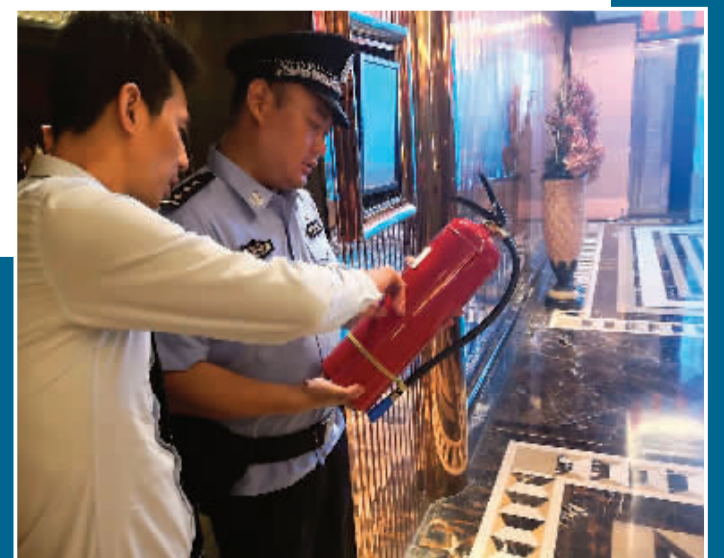
▼中秋节当晚，七星分局朝阳派出所深入人员密集场所，开展治安、消防安全专项检查。