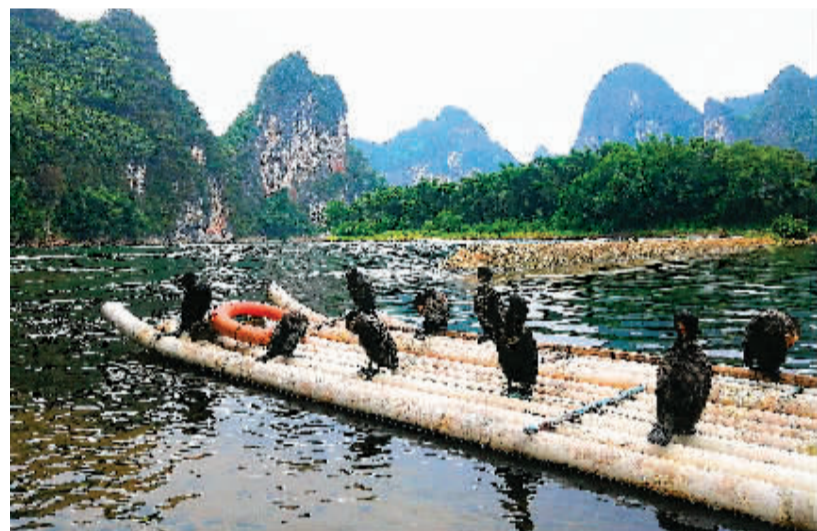
▲清澈的漓江上，正在整理羽毛的鱼鹰。

位于漓江东岸的草坪回族乡，距桂林约35公里，这里三面环山一面临水，是九山半水半分田的典型山区，民风淳朴。这里历史悠久、人文荟萃，早在秦汉时期就已是漓江水路的重要驿站。随着时代的变迁，陆路交通的发达，草坪渐渐名声不再。