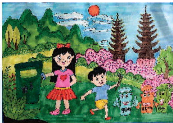
▲最美桂林 东江小学15-3班 周舟作