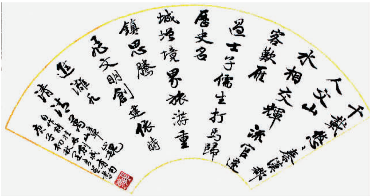
行书扇面 唐运勇书