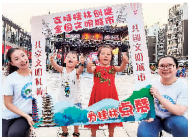
▲为桂林创城点赞