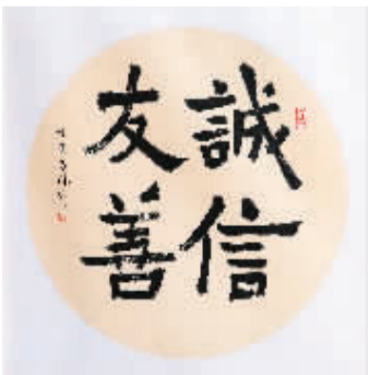
桂林市花桥美术馆 桂林宝湖教育投资有限公司协办栏目