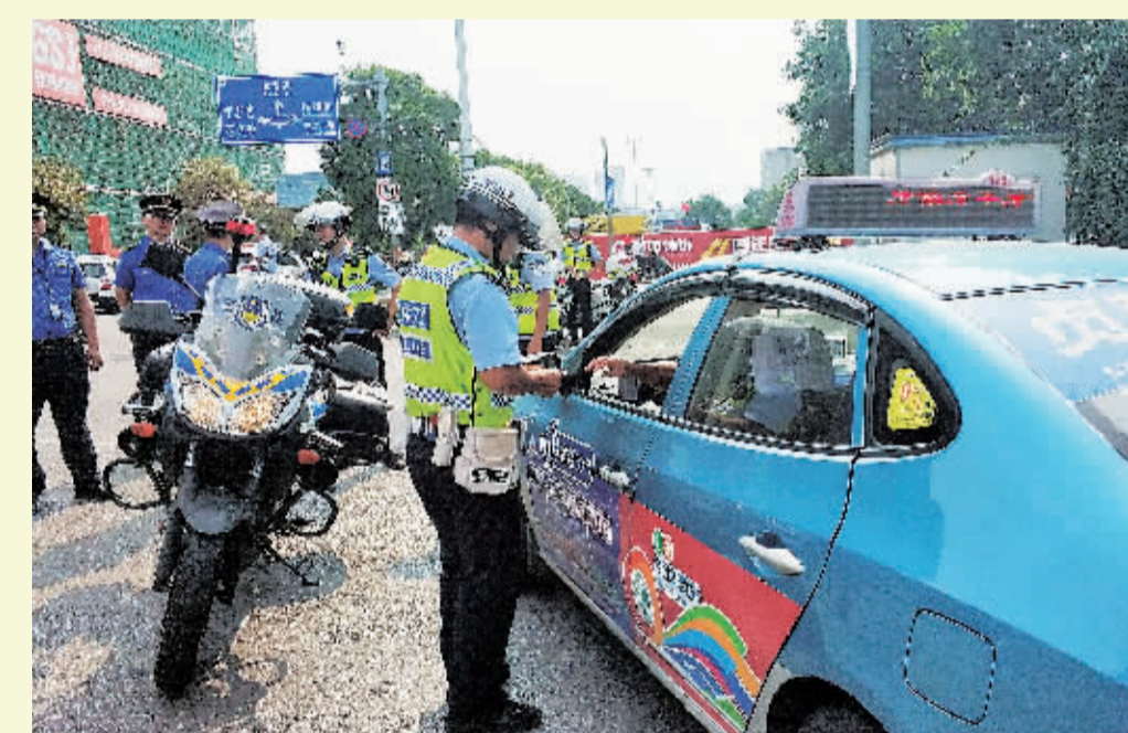
►9月2日晚至3日，市城管、公安再次联手，分4个整治组，开展新一轮针对我市突出问题整治行动，巩固创城成果，对创城攻坚进行再提升再推动。图为综合执法队伍对乱停车行为进行整治。