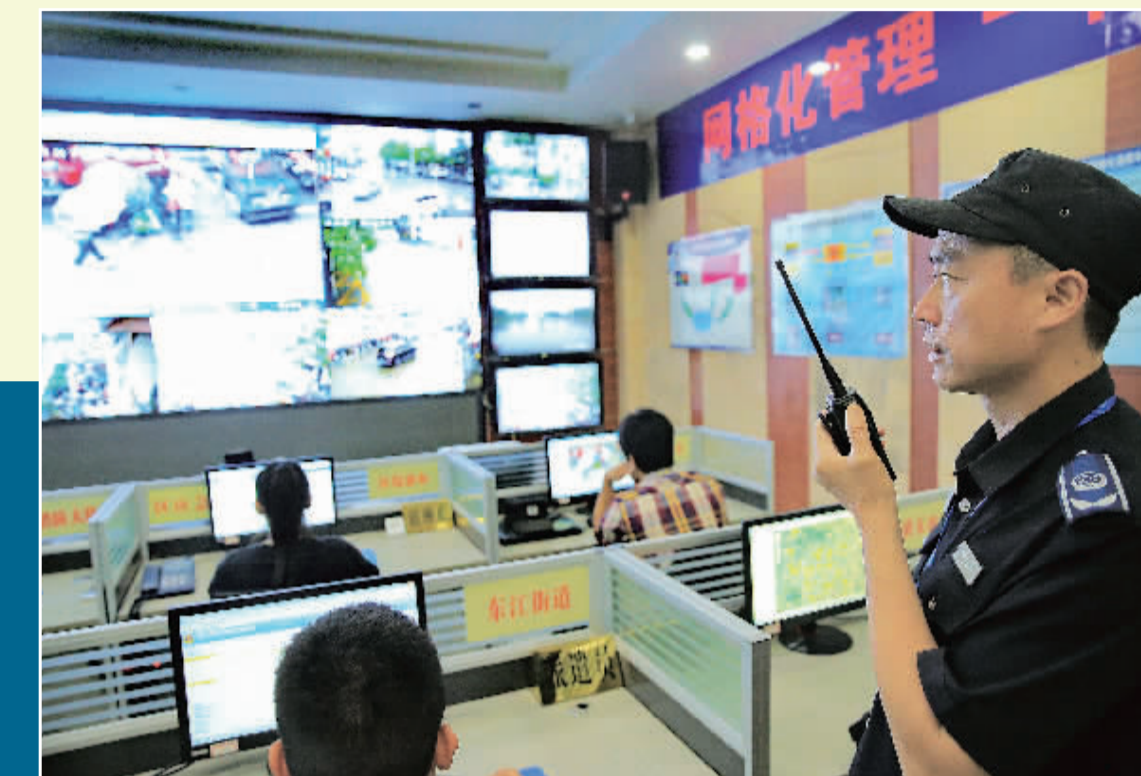
▲我市建立起数字化城市管理系统，实现“智慧城管”。