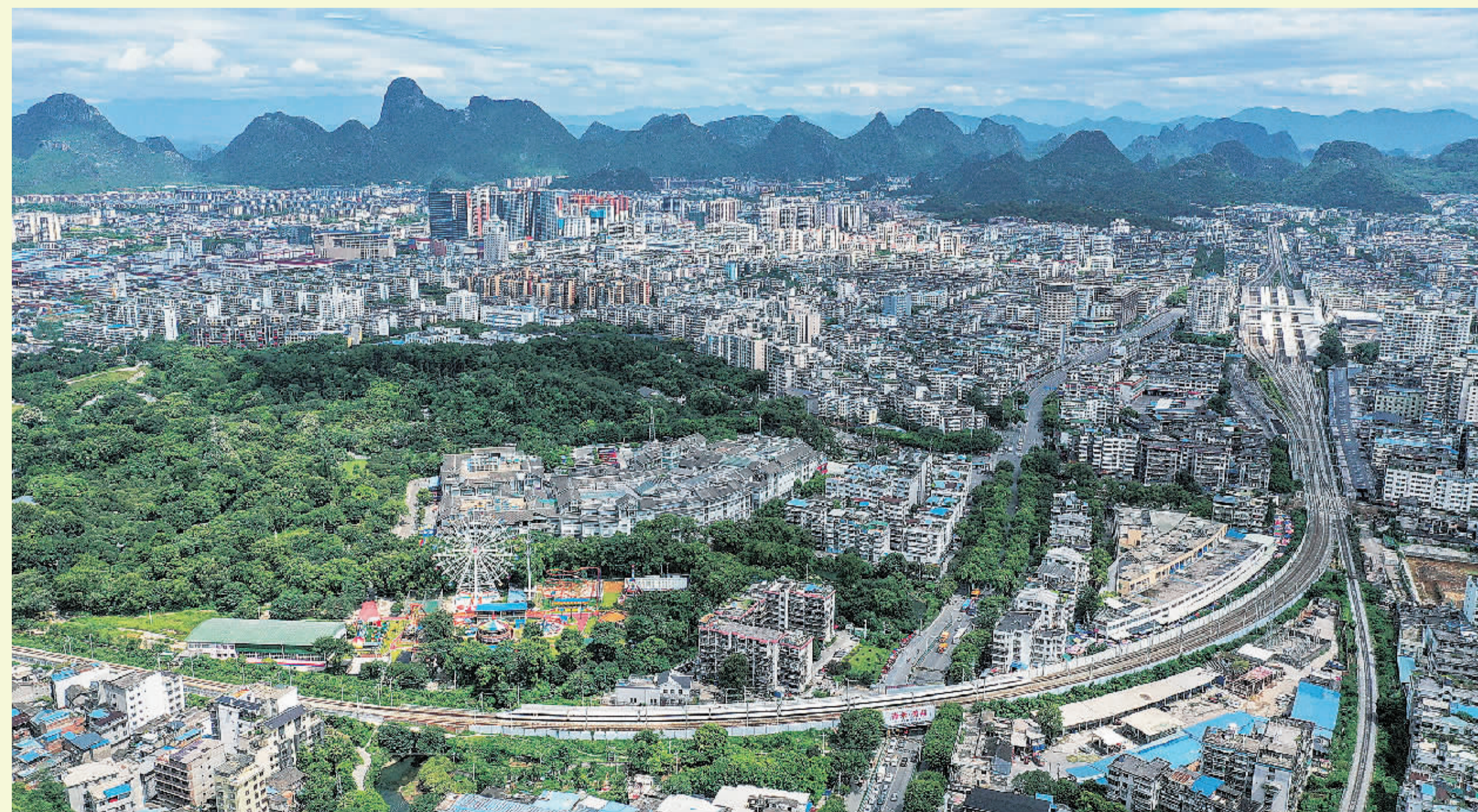
►我市以创建全国文明城市为契机，持续加大违法建筑和非法户外广告牌查处力度，加快道路桥梁修复和安全隐患排查，在市区大力营造花海等，一系列措施有效治理了“城市病”，完善城市管理，大大提升城市品位，为“美丽桂林”建设书写浓墨重彩的一笔。