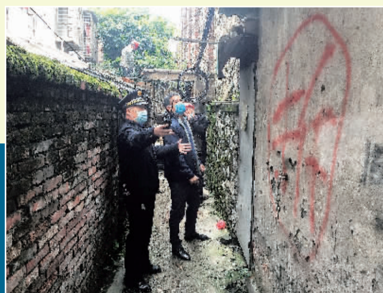
▲4月8日，秀峰区组织拆除东园村违法建筑。