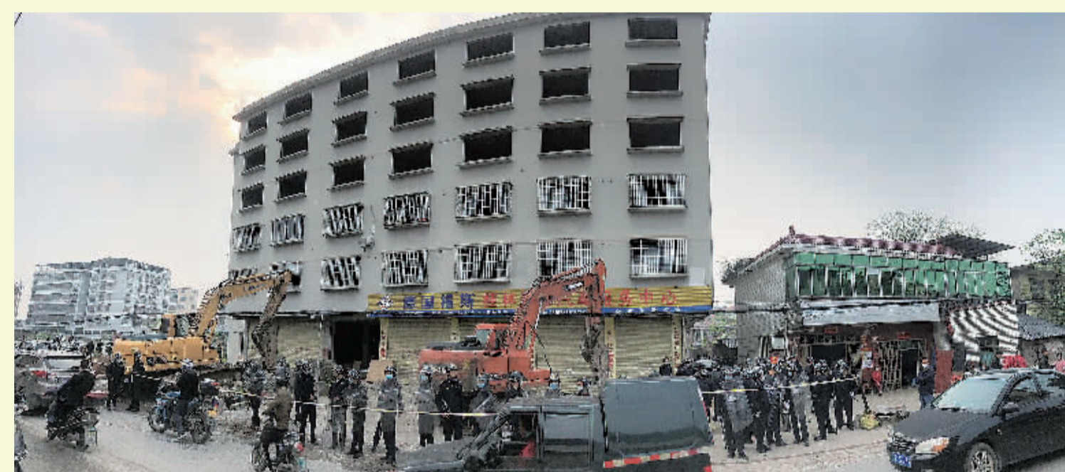
▲4月8日，叠彩区委、区政府组织该区域城管、公安交警、消防、卫健等部门，依法拆除该区域一栋违建砖混房屋。