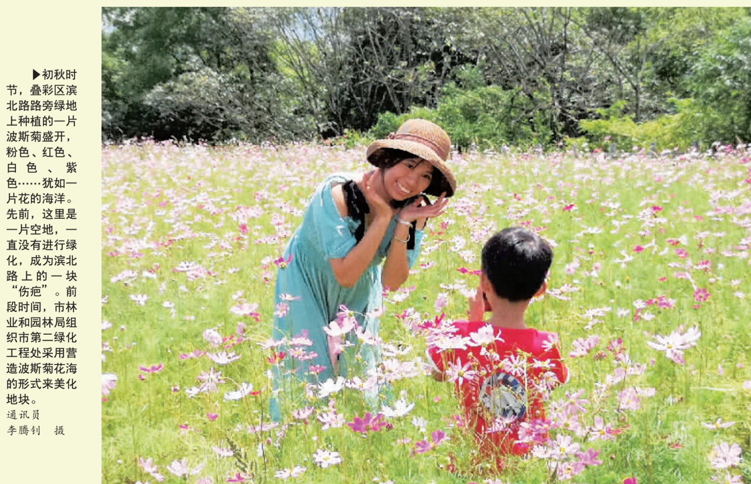
►初秋时节，叠彩区滨北路路旁绿地上种植的一片波斯菊盛开，粉色、红色、白色、紫色……犹如一片花的海洋。先前，这里是一片空地，一直没有进行绿化，成为滨北路上一块“伤疤”。前段时间，市林业和园林局组织市第二绿化工程处采用营造波斯菊花海的形式来美化地块。