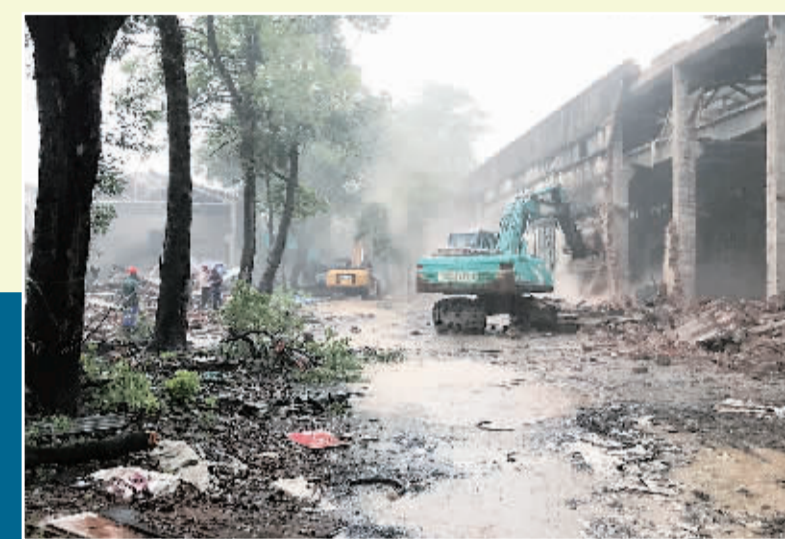
▲5月25日，象山区城管部门联合公安、办事处等部门，拆除象山区齿轮厂棚户区违建，拆除砖混房10900平方米，砖瓦房5600平方米，棚子3300平方米，围墙等构筑物2200平方米。