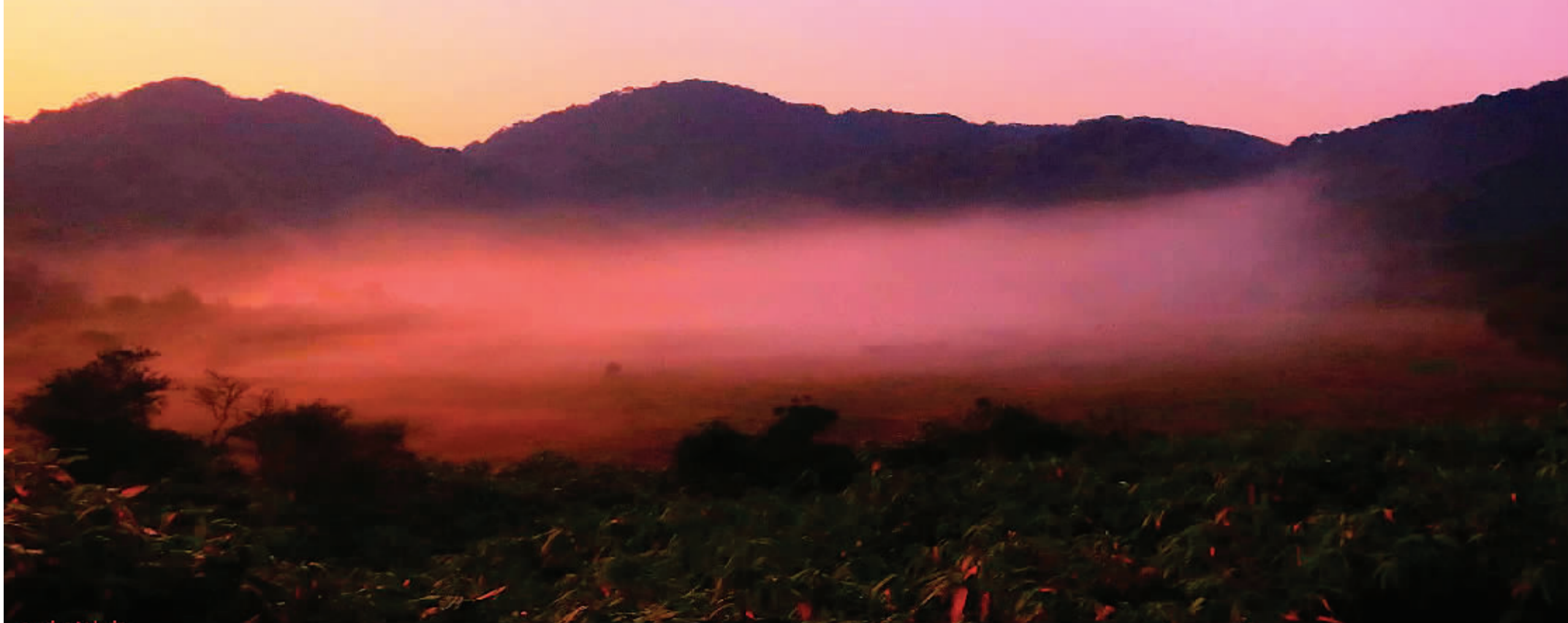
▲日出前的莲花座犹如仙境。

越城岭山脉上的宝鼎岭有宝鼎寺(唐)，哪吒山有莲花寺(仅存遗迹)，都是有名的佛教圣地，两山相距不到一公里，且主脉相连，由于宝鼎岭东面，南面，西面都是绝壁，宝鼎岭无法直接沿主脉穿越到哪吒山，只有沿西延古道下到金竹坪，再由金竹坪上到莲花座莲花寺，或宝鼎下到新村，再由新村上到莲花座，那得多花很多的时间、体力。而民间相传，宝鼎岭和哪吒山之间自古就有一条直通连接两圣地的近路的，到底有没有一条直通的古道呢？这就是我们此次直穿探寻的目的！我们此次直穿计划路线为：从新村沿山脊上到哪吒山五里