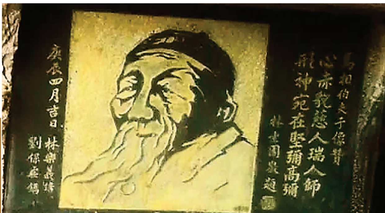
▲叠彩山风洞口左侧石壁的《马相伯夫子像》 (本文作者所藏资料图)