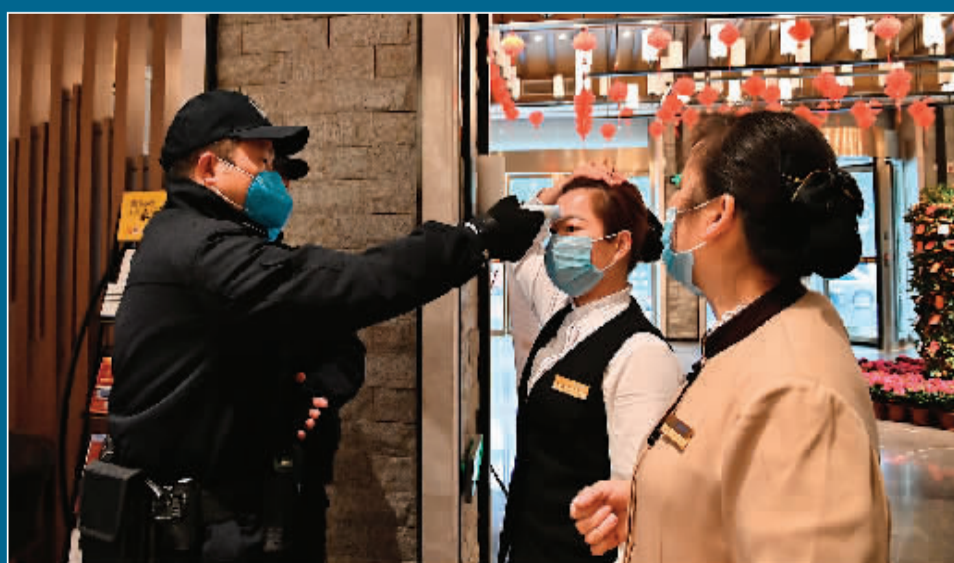
永福镇派出所民警在检查宾馆时为从业人员测量体温并告知防疫注意事项。