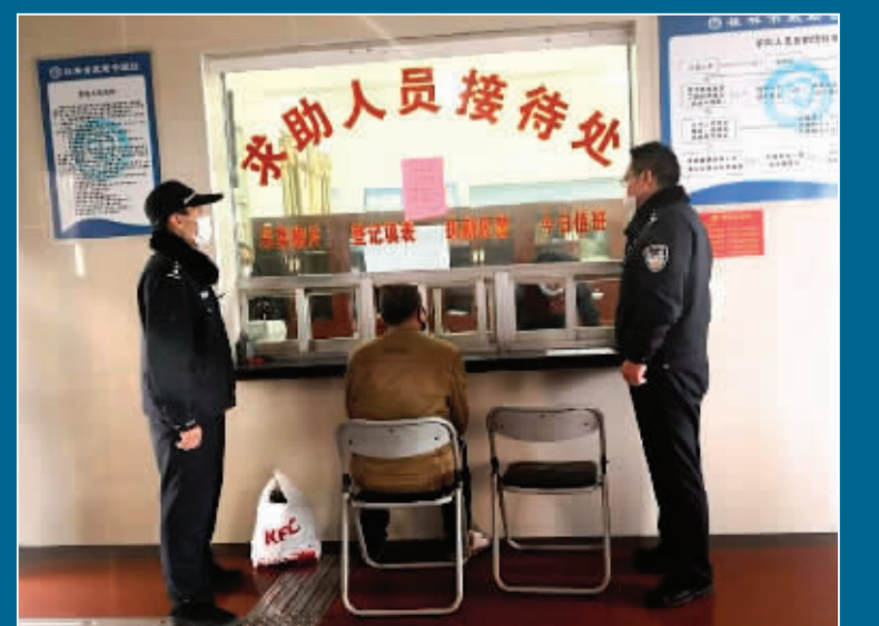
叠彩派出所民警及时将流浪人员送往救助站。