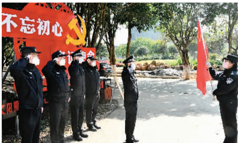
1月26日，阳朔镇派出所成立疫情防控临时党支部，参战民警对党旗宣誓许下庄严承诺。