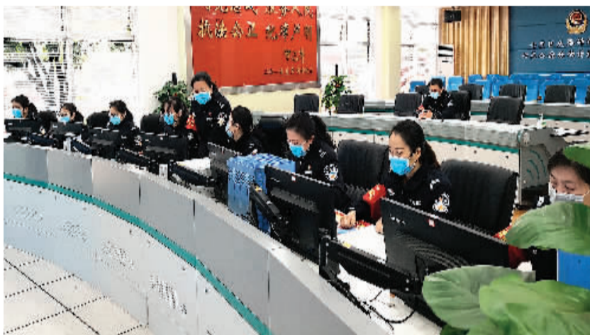
七星公安分局9位女民警，连续14天加班加点，每天收集、汇总、整理上千条与疫情防控有关的信息。

“能在这次抗击疫情的战斗中为老百姓把好这道安全关，为基层一线的兄弟姐妹们提供更精