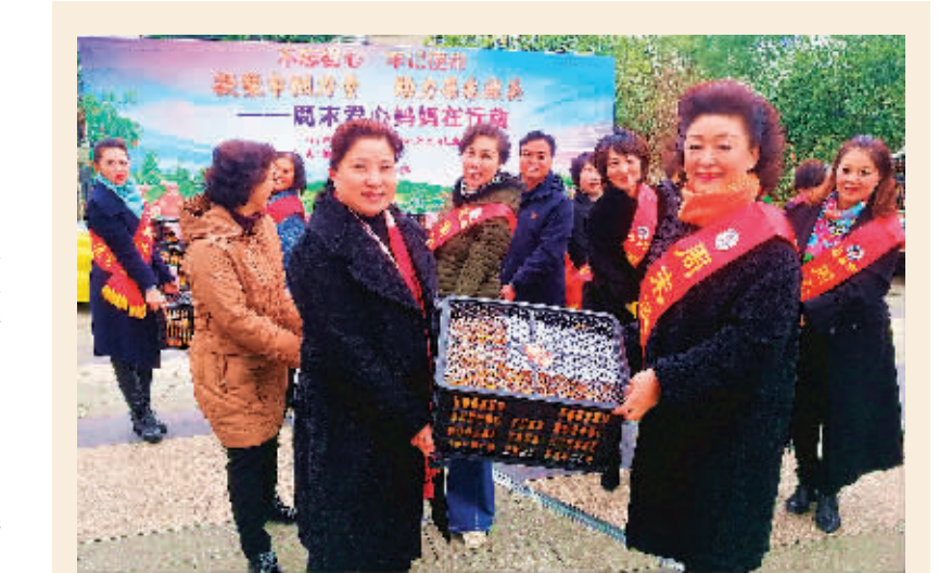
▲全州县咸水镇白竹村是自治区级贫困村。为了帮扶该村贫困群众，12月19日上午，市妇联、市女企业家协会联合组织开展了以“凝聚巾帼力量，助力果农渡关”为主题的滞销爱心认购活动。在活动中，市女企协旗下各会员企业共计购买了10多吨爱心贡柑。图为市妇联负责人与“周末爱心妈妈”志愿者在搬运认购的爱心贡柑。

刘三姐的传说流传久远，刘三姐的音乐深受海内外观众喜爱。此次受邀赴澳大利亚演出，民族歌剧《刘三姐》为当地观众呈现的是音乐会版，共派出了80余人的演出阵容。民族歌剧《刘三姐》除在悉尼歌剧院音乐厅演出外，还于12月17日在墨尔本汉墨音乐厅演出。所到之处均受到观众的热烈欢迎。华人华侨观众激动地表示，能在异国他乡听到祖国的声音、听到民族的声音，心里非常感动、温暖。外籍观众也对具有中国地方民族特色的音乐表现出浓厚兴趣，并期待欣赏更多演出。