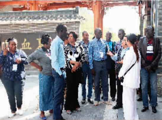
▲亚非国家疟疾防控专家团的卫生官员在崇华中医街参观了解中医药文化