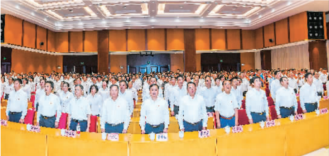
▲在家的市四家班子领导及各界干部群众集中收看庆祝中华人民共和国成立70周年大会直播时，全体起立唱国歌。

动听的山歌唱起来，幸福的舞蹈跳起来，吉祥的绣球抛起来！“壮美广西，山水胜地，民族和谐，文化绚丽”，以山水甲天下的桂林山水为