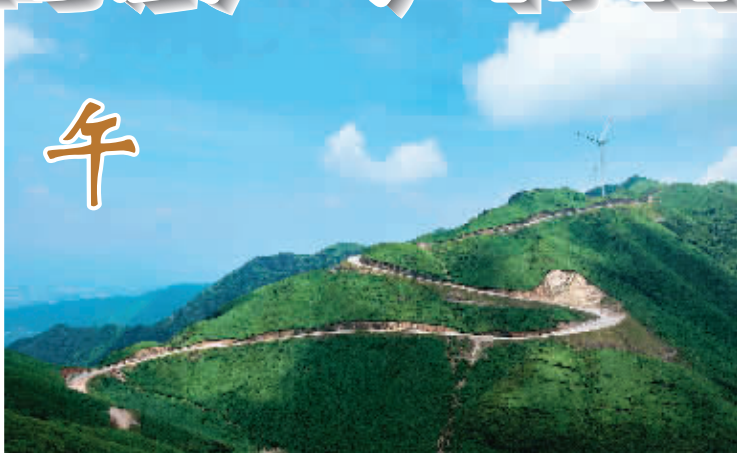
◀午时——摩天岭