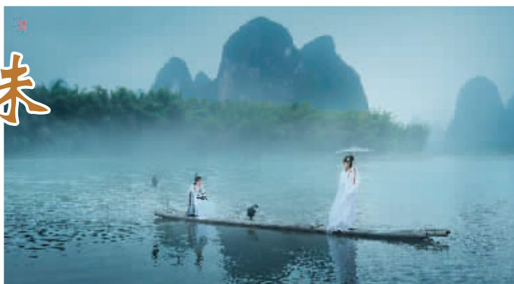
▶未时—— 泛舟漓江