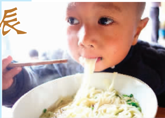
◀辰时—— 米粉时光