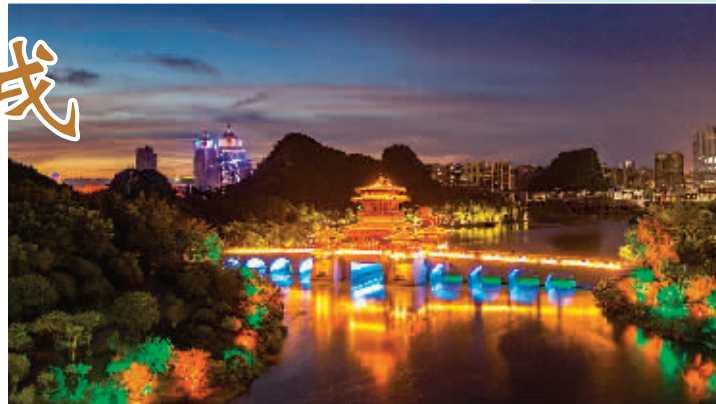
▶戌时——临桂 中央公园