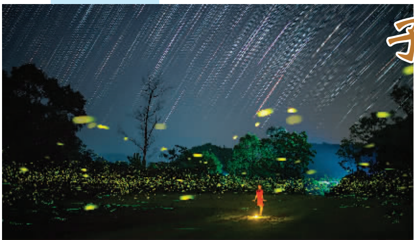
◀子时—— 萤火辉光