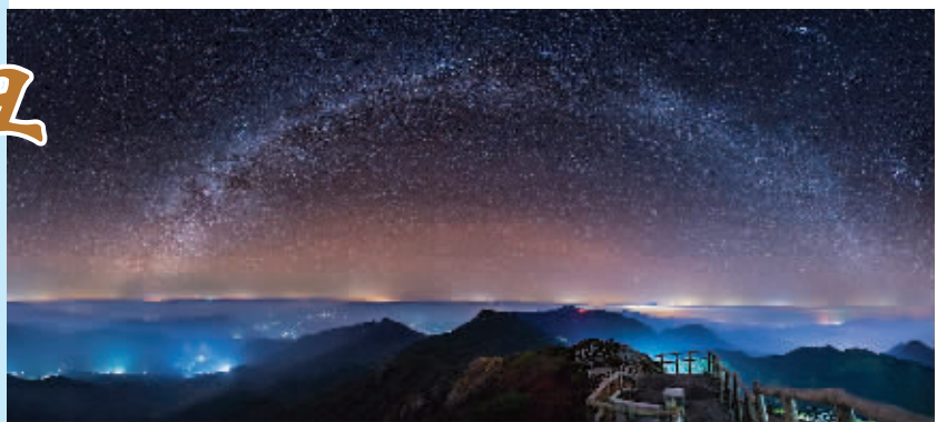
▶丑时——华南之巅