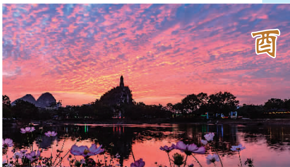
◀酉时—— 塔山晚霞

最美的桂林十二时辰，每一帧画面，都美得让人窒息。桂林，最美的山水之城，我们的城。看一眼，就会爱上。爱上了，就不会离开。