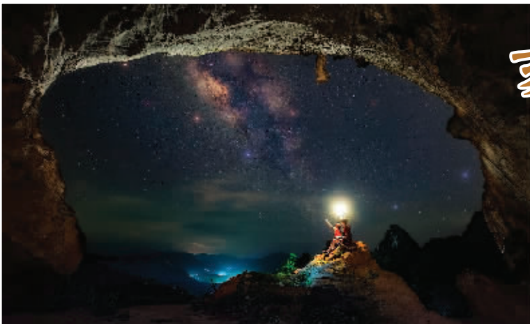
◀亥时——粉岩与星空