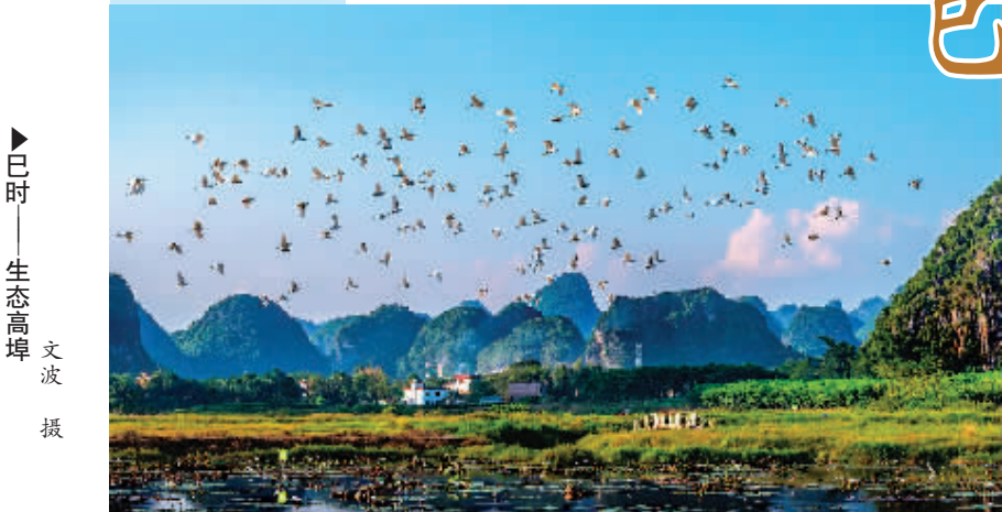
▶巳时——生态高埠 文波 摄