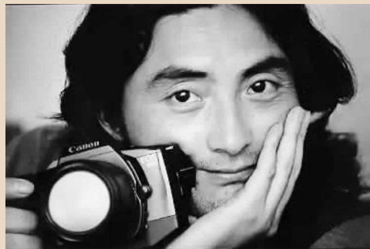
▲著名肖像摄影师 肖全