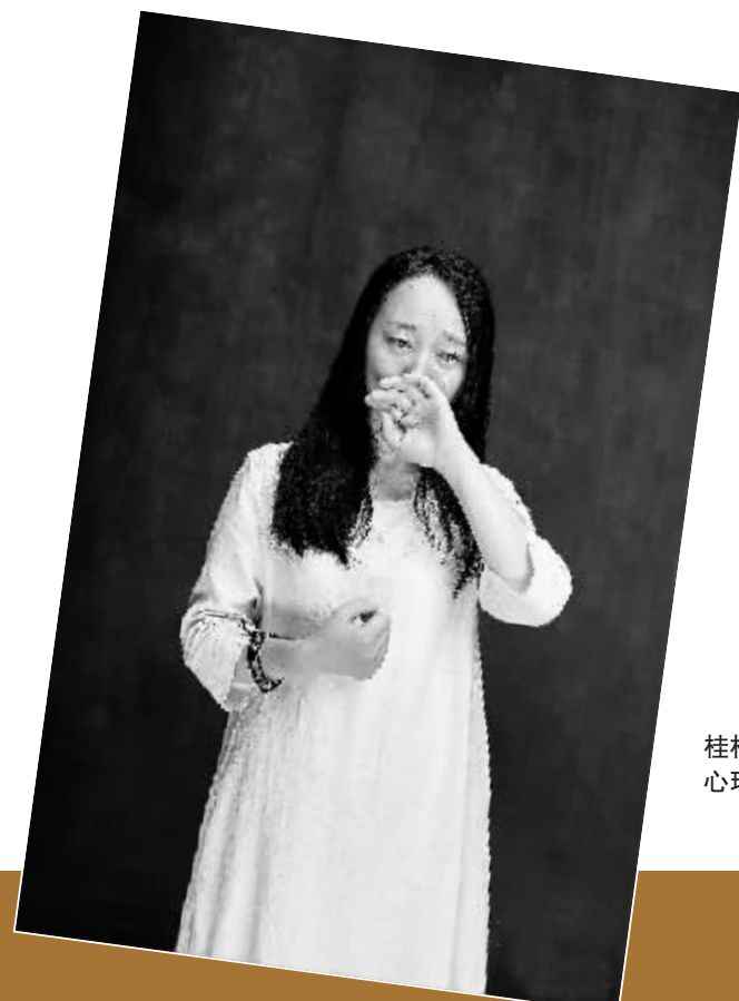
◀肖全拍摄的桂林人肖像之二 心理咨询师