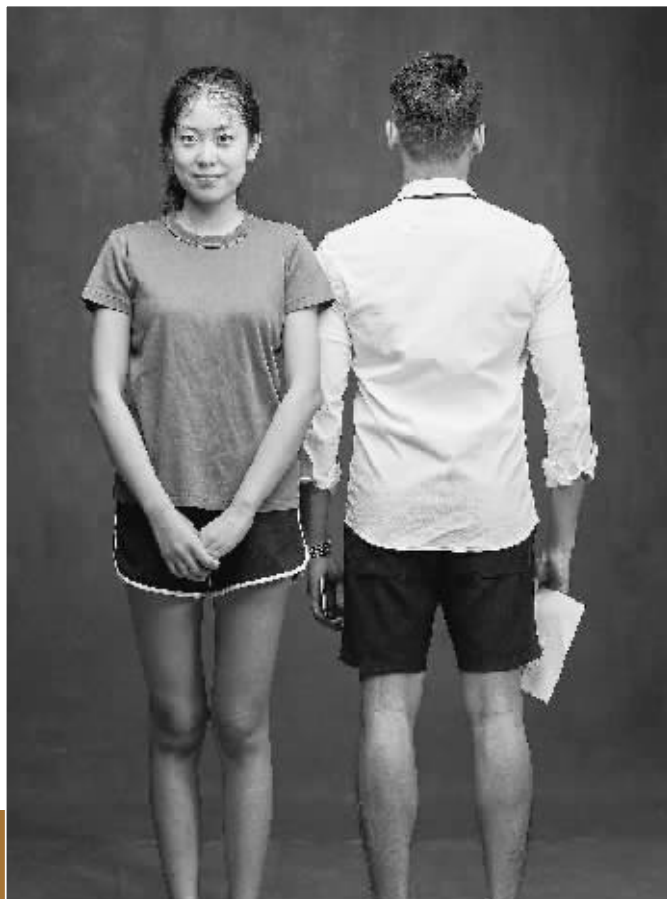
▲肖全拍摄的桂林人肖像之一