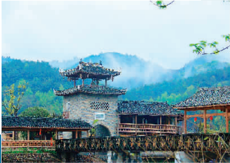
▲旅游改革产业试点项目——大圩滴水人家项目园内得月楼。