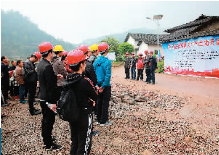
▲荔浦市自然资源局积极实施土地开垦项目,解决贫困村无田可耕种的尴尬局面,助力贫困村早日脱贫。