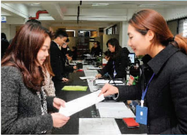
▲创新不动产登记新模式,群众满意度不断提升。图为工作人员为群众提供咨询服务。