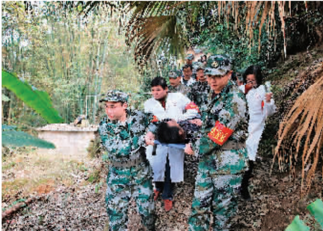
▲荔浦市自然资源局将开展地灾群测群防工作作为一项重要民生工程来抓,积极开展地灾科普知识的宣传和培训、地灾抢险救灾演练,让群众掌握防灾避险知识。