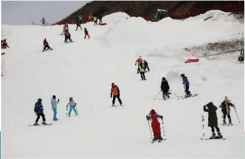
▲桂林旅游产业用地改革为一大批旅游项目落地提供了土地保障。图为全州利用该政策建起的天湖滑雪场。