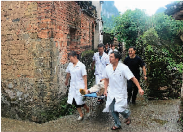
▲灵川县三街镇西崴上村地质灾害演练场景