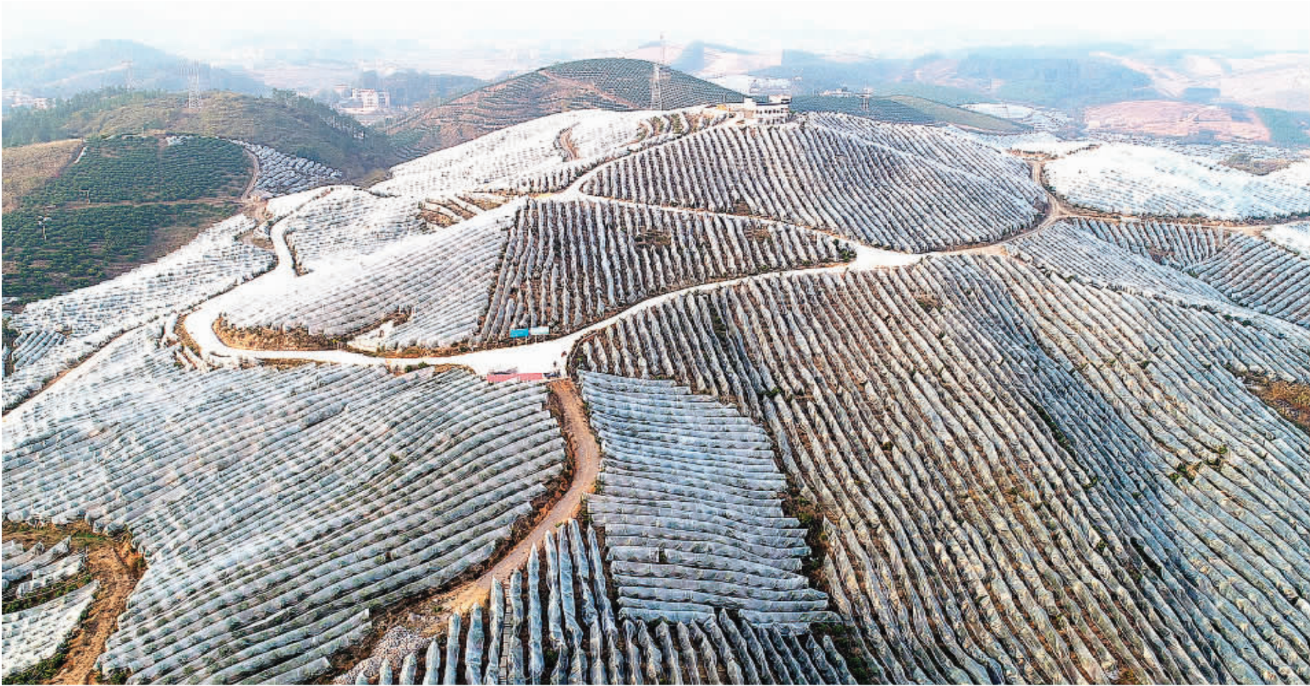
▲荔浦市自然资源局把实施土地整治融入到乡村振兴战略计划中,近年来,先后投资1.5亿元用于土地整治,不断提升土地综合能力,引导农民发展特色种植。图为该市万亩橘海一角。

去年,我市继续加强矿产资源管理工作。市县两级矿产资源总体规划发布实施,矿产规划备案材料及数据库成果汇交圆满完成。据市自然资源局相关负责人介绍,去年全市第一批9家试点采石场相继竣工验收,