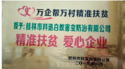
▲桂林科迅公司获得的“精准扶贫爱心企业”牌匾

2月24日，全国铁路预计发送旅客1220万人次，同比增长39.7%，铁路客流持续高位运行。 铁路春运客流持续走高，各地铁路部门采取有效措施，加大站车服务力度，打通春运出行“最后一公里”，让旅客体验更美好。沈阳局集团公司有部分列车配备“无线呼叫器”，为行动不便的重点旅客提供“随叫随到”的服务；北京局集团公司各大车站为重点旅客提供电话、微博预约服务，使进出站更加方便快捷；郑州局集团公司各车站启动大客流运输服务方案，优化售票组织，增加进出站通道和实名制验证岗位人员，最大限度为旅客提供便利；太原局集团公司太原南站启动“铁公机”应急机制，在协同城市公共交通部门确保到达旅客安全及时疏散的同时，积极挖潜扩能，采取增加列车编组，增开周末高峰列车等措施，共计增加运能1.3万余个。