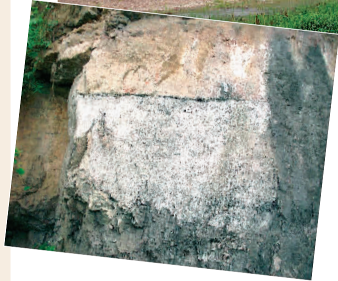
◀已经模糊的堰坝管理民约碑

水时，人可进入岩洞口5米左右），该岩引堰塘之水入崩山山底下的地下河后，去向不明。由于崩山潭的堰塘之水，与地下河相通。故此堰塘蓄水河段鱼类品种也多，加之水深，水面宽。所以每年春天都有许多鱼虾在此产卵繁殖，使该堰塘成为鱼虾的天堂。又经夏秋季节的自然生长，堰塘中不但鱼虾数量多，而且以鲤鱼、鲫鱼（又叫“圆鱼”、或“鳖”）、鲢鱼、塘角鱼著称。自古成为垂钓爱好者的的好去处，同时也成为冒险破堰放水取鱼者的目标。