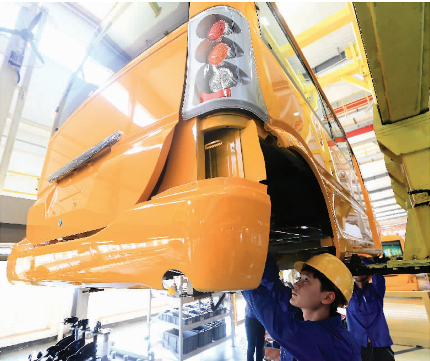
▲桂林经开区五菱校车生产车间一角。