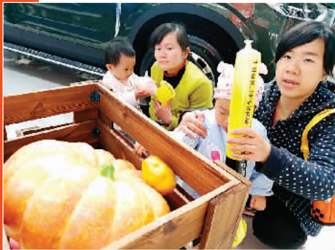
▲市民拖儿带女来看车展。