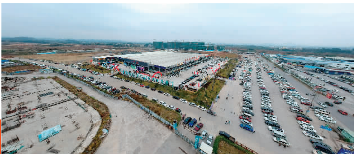
▲车展展馆前停满了车。