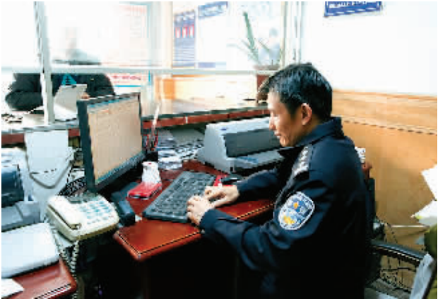
▲民警通过微信平台接受市民预约办理临时身份证。

本报讯（记者王文胜 通讯员吴金华 陈文萍 文 摄）去年12月底，平乐县公安局官方微信“平安平乐”正式推出微信服务平台，全力打造“指尖”警务，微信预约办理临时身份证、涉警信访、举报违法犯罪可以一键搞定。