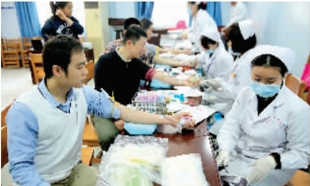
▲市人民医院的工作人员积极献血。

《白衣天使紧急捐骨髓 为生命“续航”》后续—— 近30名“白衣天使” 申请加入中华骨髓库